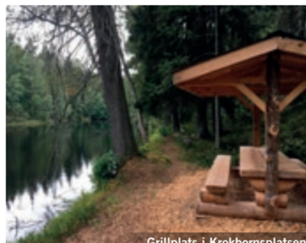
Grillplats i Krokbornsplatsen