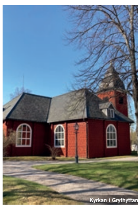
Kyrkan i Grythyttan