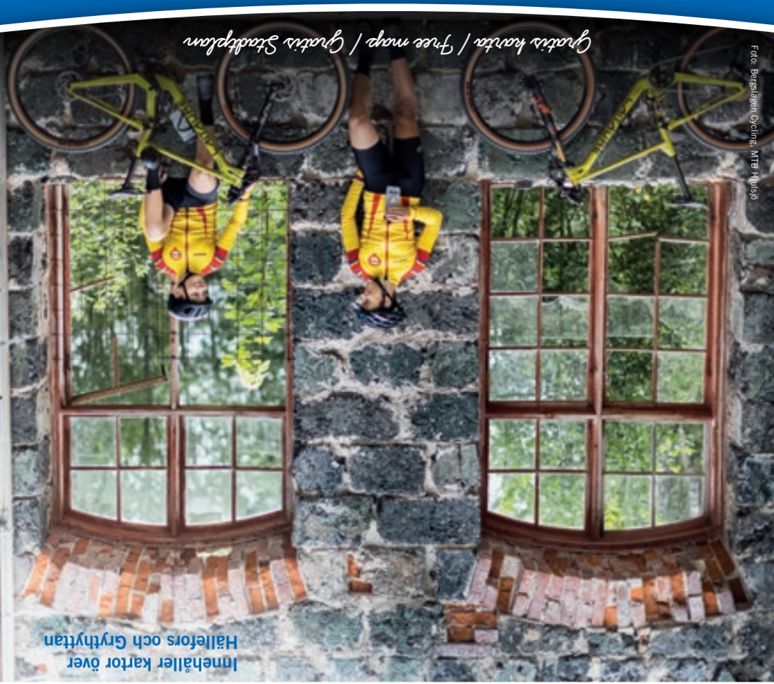
Innehåller kartor över Hällefors och Grythyttan