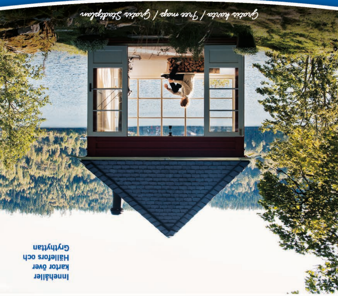
Innehåller Hällefors och Grythyttan